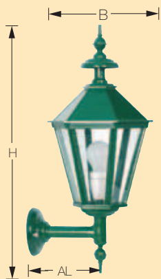
Art. 1610 SWD