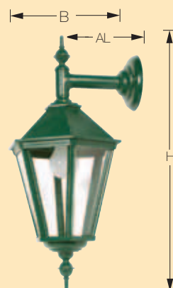
Art. 1610 HWD

☑ Geeignet zum Befestigen auf normal entflammare Befestigungsflächen